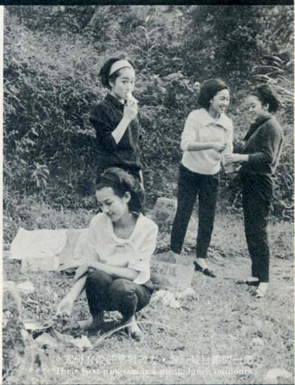
。究研有最狂熱對奇方，樂野是目遊一第 Their first program is a picnic lunch outdoors.