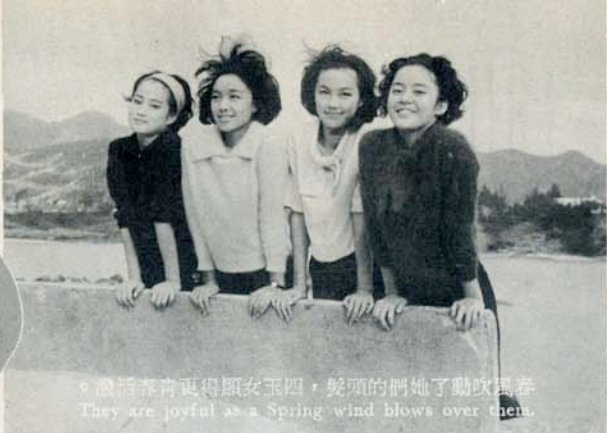
。濃清春育更得顯女玉四，髮頭的們她了動吹風春 They are joyful as a Spring wind blows over them.