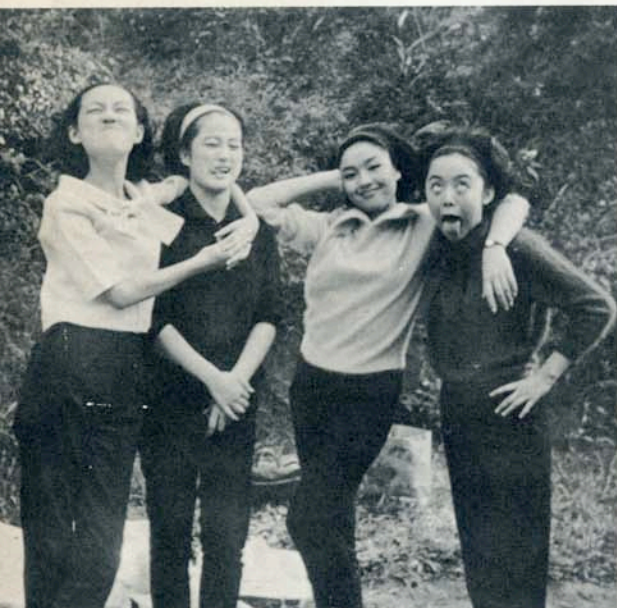
。美的來本了不蓋掩然依，笑人逗臉鬼扮，子妮小的氣淘 Just a funny face to make some body have a good, hearty laugh.