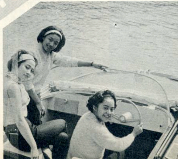
灣山青在艇快小 她，浪破風乘面海 ！來起叫得樂快們 Everybody gets ex- cited as speedboat cruises Castle Peak Bay.