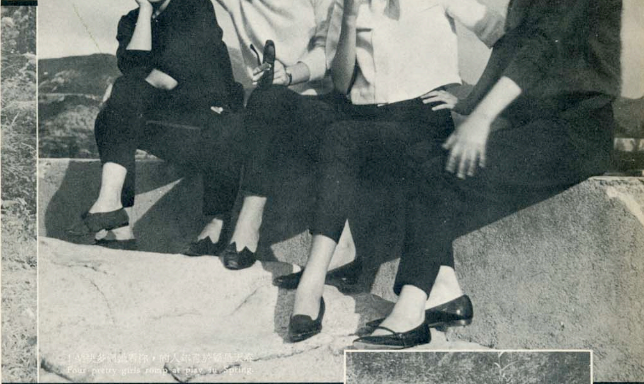
。遊快多們誠看欣，的人年高於願為天春 Four pretty girls romp at play in Spring.