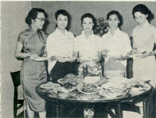
行錢敏尤為等芸陳翠林蘭葛衛淑汪 Grace Chang, Lin Tsui, friends give her a send-off.