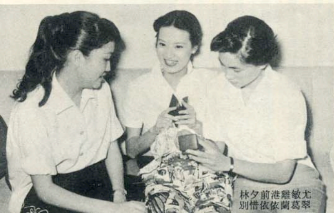
林夕前港離敏尤 別惜依依蘭葛翠