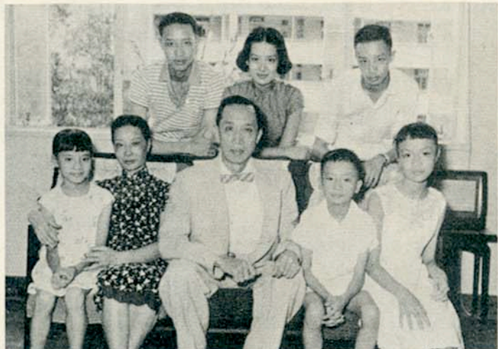
歡家合張一的們妹弟及媽媽爸爸的她與敏尤 Group picture of the whole family.